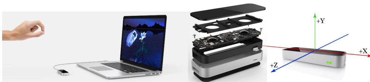
2. ábra Leap Motion kontrollert felépítése és használata (Leap Motion Inc, 2019)

A kontrollert a Leap Motion Inc. hozta létre és fejleszti 2010 óta. Az egység üzembehelyezése egyszerű: USB kábelen keresztül csatlakozik a számítógéphez vagy Mac-hez, amelyen keresztül a tápellátása és az információátvitel is történik. A kapott adatokat a cég által fejlesztett szoftver végzi a számítógépen, valós időben. Az eszköz nem csak a kézfej, hanem minden egyes ujj mozgását külön érzékelni tudja. A kéz és ujjak érzékelését az egység szélén elhelyezett monokróm infravörös kamera és három infravörös LED teszi lehetővé. Az egység érzékelési tartománya egy körülbelül 1 méter átmérőjű, nagyjából félgömb alakú térrész. A LED-ek folyamatosan infravörös fényt bocsátanak ki, két kamera pedig 300 FPS sebességgel képeket készít a LED-ek által megvilágított területről. Az elkészült képeket a vezérlő a számítógépünkre továbbítja, ahol a Leap Motion szoftvere matematikai algoritmusok segítségével feldolgozza a két kamera képét, és így a 2D-s forrásokból 3D-s, a kéz- és ujjpozíciókra vonatkozó értékeket tud kiszámítani, amely alapján a vezérlés történik.