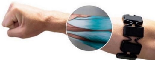
1. ábra Myo kézi gesztusérzékelő egység (Myo, 2019)

Az egyik ilyen például a Myo armband (Myo, 2019) – amely az úgynevezett elektromiográfia (sEMG) (SZTE - Orvosi Fizikai és Orvosi Informatikai Intézet) vizsgálati módszer alapján működik. Ennek lényege, hogy a bőr felszínén kialakuló potenciálingadozást mérjük, amely a bőr alatti izommozgás hatására alakul ki. Ezt az ingadozást a bőrre helyezett elektródákkal lehet kimutatni (1. ábra).