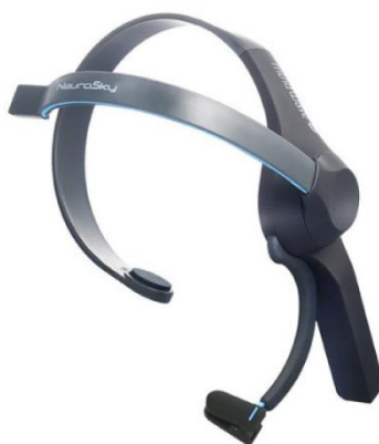
4. ábra MindWave EEG Headset (Katona, 2018)